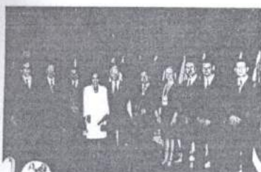
Integrantes da mesa solene do Encontro.

Os participantes do II Encontro Internacional de Direito Humanitário e Direito Militar, em Florianópolis - SC, dedicaram os dois primeiros dias do evento à criação, redação e discussão do estatuto da Associação Internacional das Justiças Militares - AIJM.