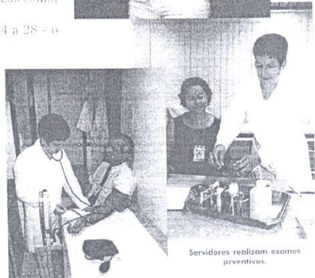
Servidores realizam exames preventivos.