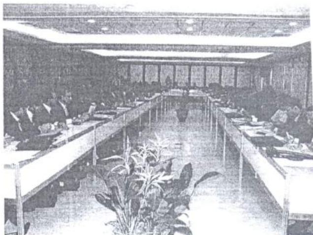
Reunião conjunta de Ouro Preto.

No 38º Encontro do CNCGMMP realizado no Hotel Plaza São Rafael, em Porto Alegre,