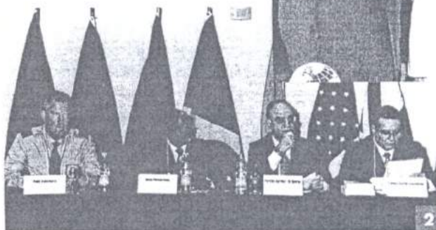
2) Debate coordenado pelo corregedor-geral do MPM