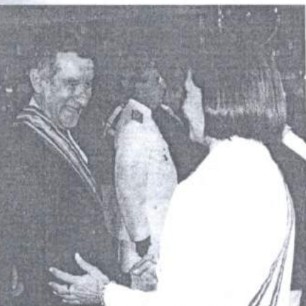
Presidente do TCU recebe medalha da procuradora-geral.