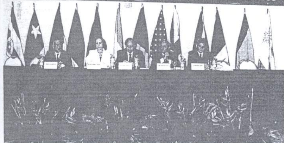
Procuradora-geral participa de debates sobre "A Perda do Posto e da patente de Oficiais".

Encontro Internacional de Direito Humanitário e Direito Militar FLORIANÓPOLIS, SC - BRASIL | 3 A 6 DE DEZEMBRO DE 2003