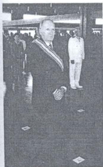
Maurício Corrêa, presidente do STF, um dos agraciados.