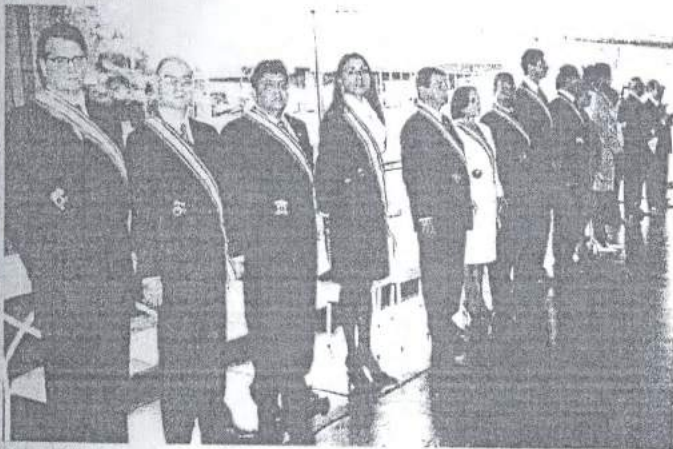
Conselheiros da Ordem do Mérito MPM.

Institucional, General de Exército Jorge Armando Félix, o embaixador da República Popular da China, Jiang Yuande e o embaixador da República da Hungria, Tamás Rózsa. As corporações agraciadas com a insígnia da Ordem do Mérito MPM foram: o Comando do Exército, o Centro de Preparação