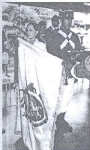
A chanceler da Ordem condecora estandarte.