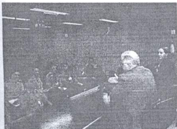
Corregedor-geral fala sobre a Justiça Militar.

Alunos do Curso de Formação do Quadro Complementar de Oficiais, da Escola de Administração do Exército, assistiram em novembro (5), na Procuradoria-Geral da Justiça Militar, a palestra sobre a história, funcionamento e estrutura da Justiça Militar.